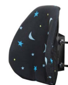
Encosto Matrx Mini